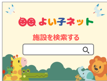
【施設名や地域から検索】